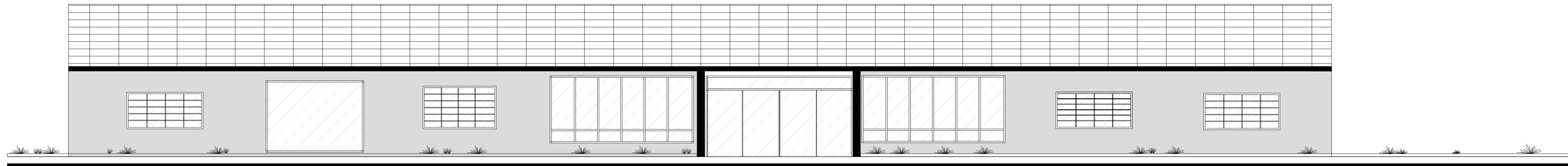
FACHADA FRONTAL ESCALA 1:75

PROPRIETÁRIO E RESP. PELO USO: PREFEITURA MUNICIPAL DE SANTO ANTÔNIO DE POSSE